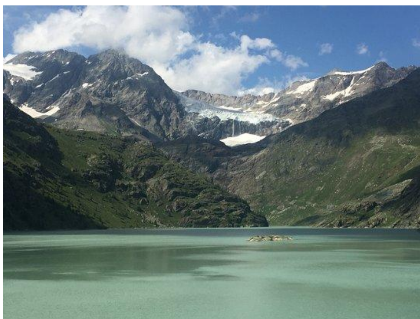
Vista dal lago Gera sul rifugio Bignami (in alto a sx) e il Fellaria

FACOLTATIVO: alla forcella di Fellaria è possibile deviare dal sentiero previsto per effettuare la salita al Sasso Moro (3108mt, EE). La salita richiede un dislivello aggiuntivo di 250mt e si svolge su sentiero roccioso per escursionisti esperti, leggermente esposto.