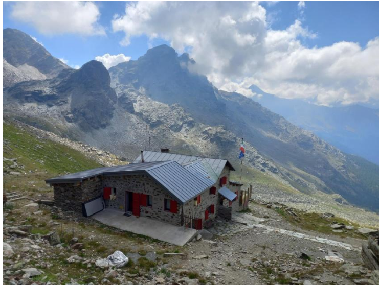
Vista dal rifugio Carate