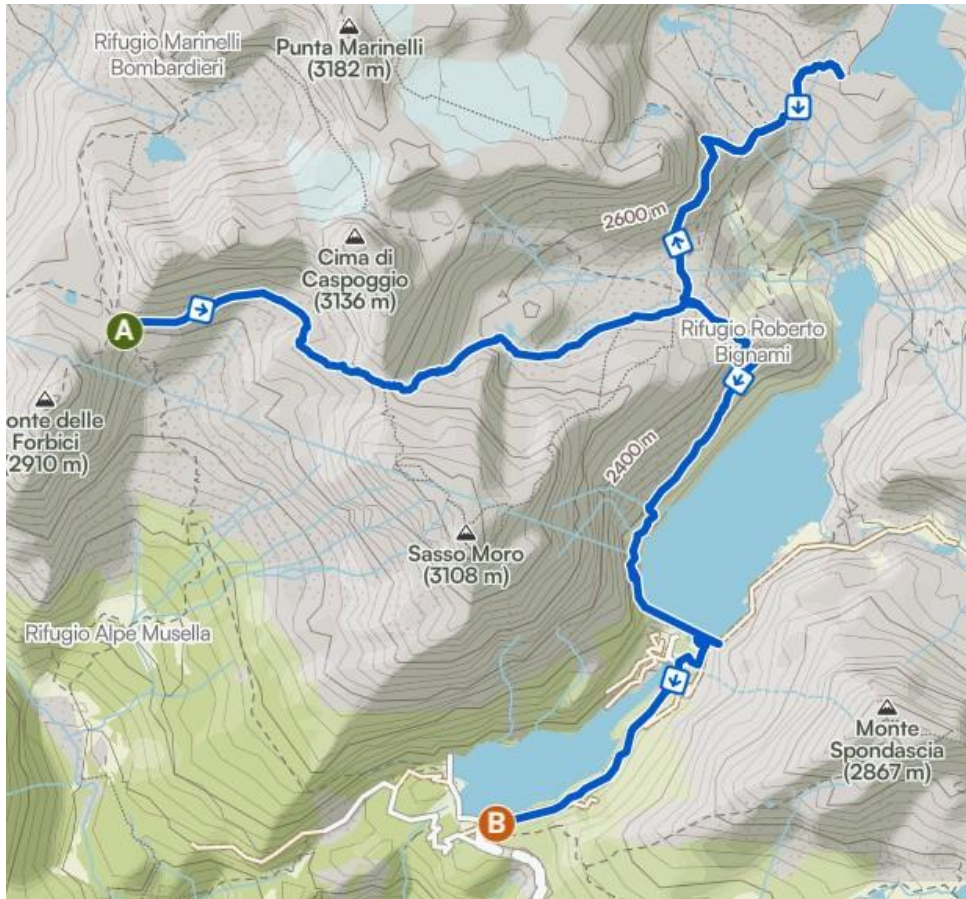
Itinerario giorno 2